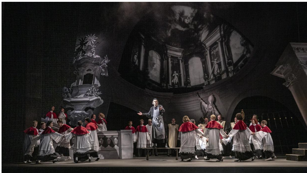
Tosca (Národní divadlo - Státní opera)