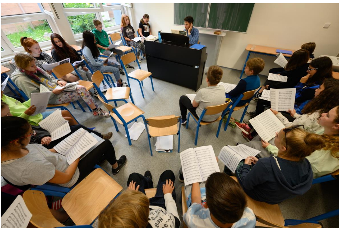
Letní umělecké soustředění (Žihle)