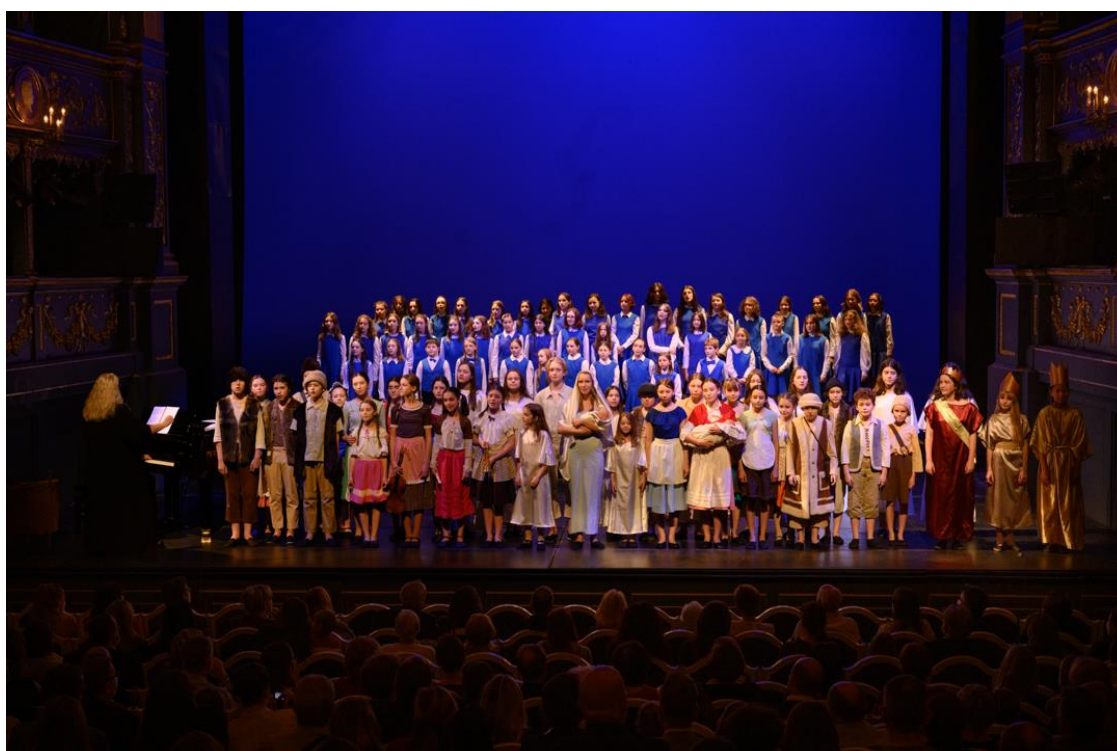
Vánoční koncerty (Stavovské divadlo)