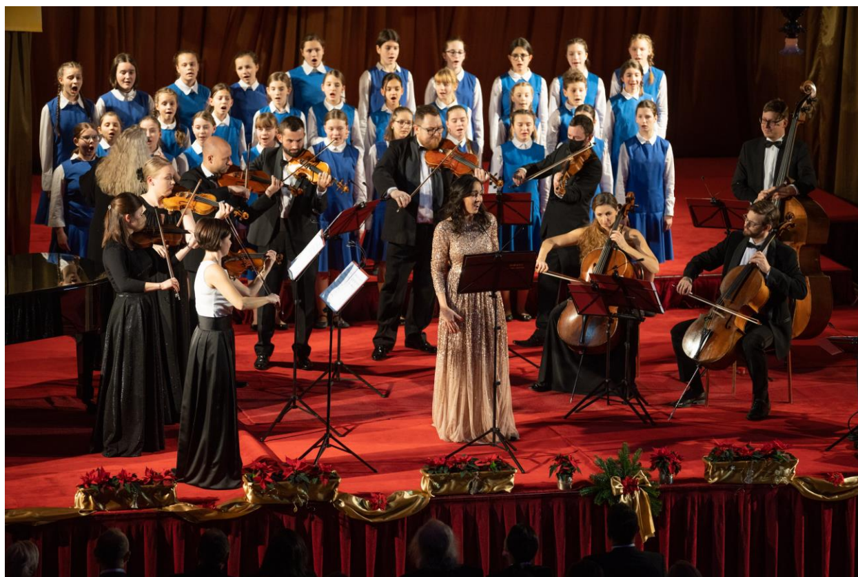
Vánoční setkání v rámci festivalu Svátky hudby (Palác Žofín)