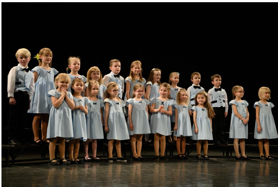
Vánoční koncerty (Městská knihovna)