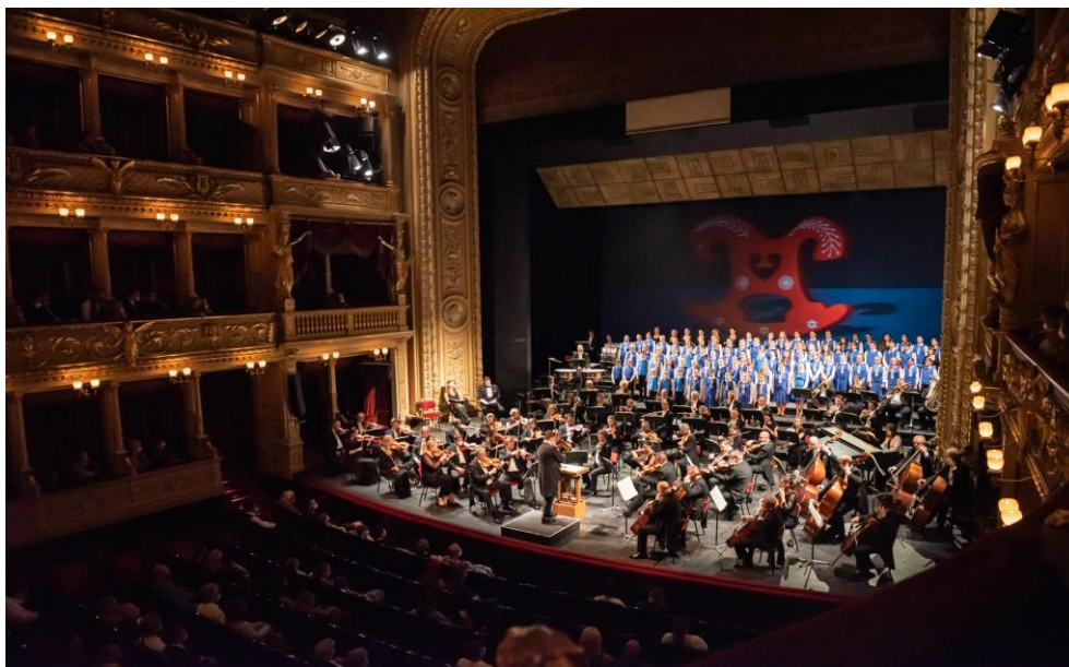
B. Martinů: Špalíček (Národní divadlo)