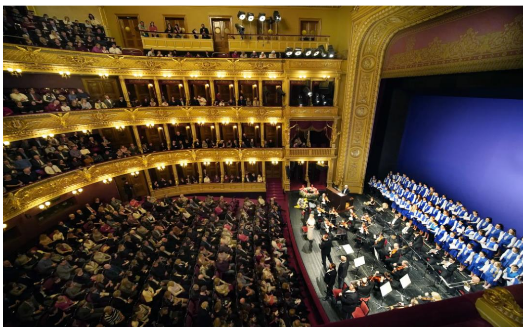
Adventní koncerty (Národní divadlo)