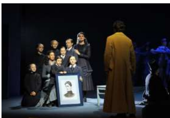
červen 2018: premiéra opery Werther (Národní divadlo)