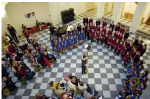
duben 2018: Společný koncert malých zpěváčků (České muzeum hudby)