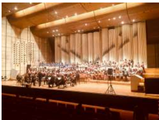
červen 2018: koncertní zájezd Slovensko, Maďarsko