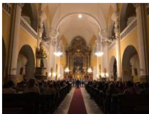
září 2018: Svatováclavský hudební festival (Nový Jičín)