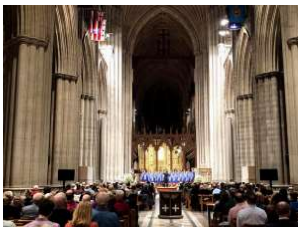
září – říjen 2018: Turné USA