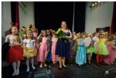
duben 2018: Benefiční koncert pro Dětské krizové centrum (KZ Domovina)