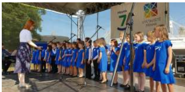
květen 2018: Rodinný den Prahy 7 na Výstavišti