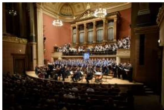
prosinec 2018: Velký vánoční koncert (Rudolfinum)