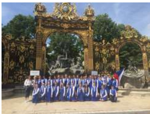
květen 2018: Voix du monde (Nancy, Francie)