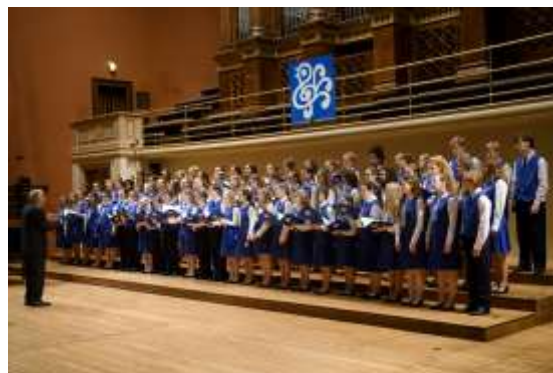
červen 2018: Závěrečný koncert KDS (Rudolfinum)