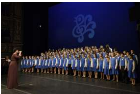
prosinec 2018: Závěrečné koncerty (Stavovské divadlo)