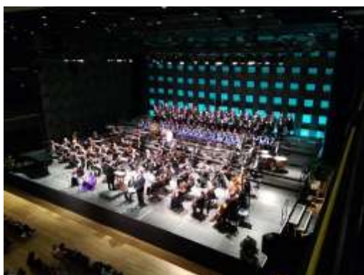
prosinec 2018: Vánoční koncert Státní opery (Fórum Karlín)