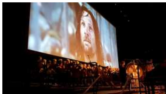
prosinec 2018: Turné Pán prstenů (Německo)