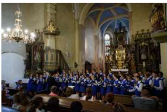
srpen 2018: benefiční koncert v rámci LUS 2018 (Kralovice)