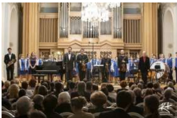
prosinec 2018: Dny Bohuslava Martinů (HAMU, Praha)