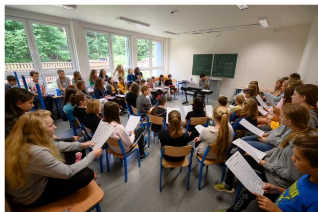
Mahlerova Symfonie č. 3 d moll pod taktovkou Zubina Mehty v rámci festivalu Dvořákova Praha