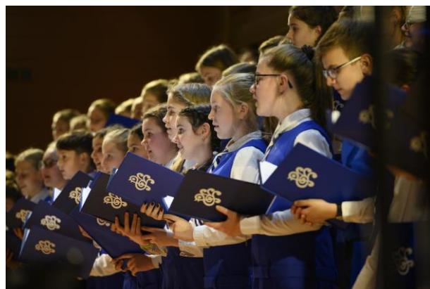
Vánoční koncerty ve Stavovském divadle